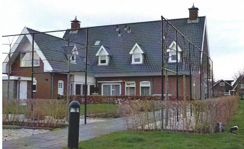
Vernieuwing aan de achterzijde