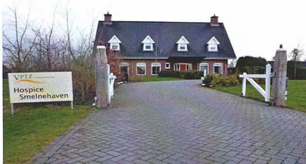
Inrit Hospice Smelnehaven

Primair doel van VPTZ ZOF is aan een ieder in de laatste levensfase en diens naasten- daar waar nodig en gewenst- tijd, aandacht en ondersteuning te bieden door goed opgeleide vrijwilligers. De kwaliteit van zorg die wordt geboden aan onze cliënten/gasten is een permanent punt van aandacht. Investeren in kennis en kunde van de vele vrijwilligers en