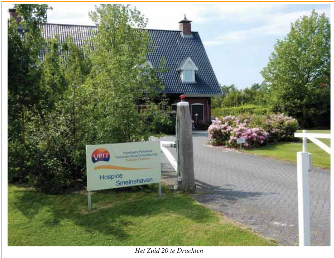
Het Zuid 20 te Drachten